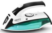
Travel Iron CR 5024