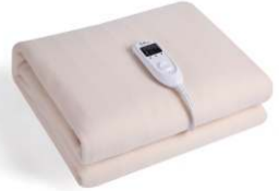
Electric Blanket CR 7407