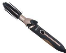
Hair styler set CR 2024