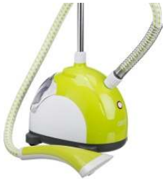
Steam Cleaner CR 5020