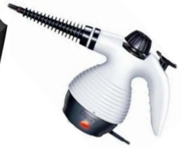
Steam Cleaner CR 7021