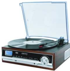
Turntable CR 1113