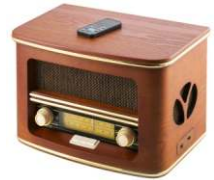
Retro radio CR 1109