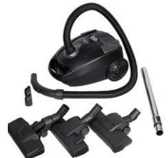
Super silent vacuum cleaner CR 7037