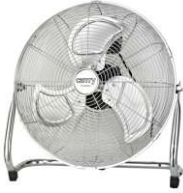
Velocity Fan CR 7306