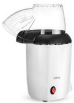
Popcorn maker CR 4458