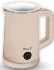
Automatic milk frother CR 4464