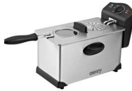
Deep Fryer 3L CR 4909