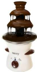
Chocolate Fountain CR 4457