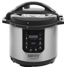
Pressure cooker CR 6409