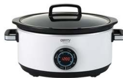
Slow Cooker CR 6410