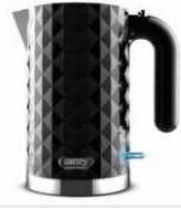
Electric Kettle CR 1169