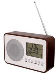
Radio CR 1153