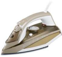
Steam iron CR 5018