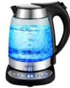
Electric Kettle CR 1242