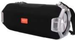
Bluetooth Speaker CR 1170