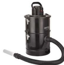
Ash Vacuum 25L 1200W CR 7030