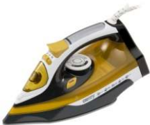
Steam Iron CR 5029