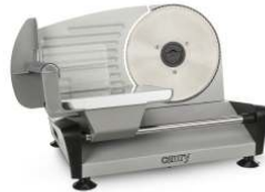
Food Slicer CR 4702