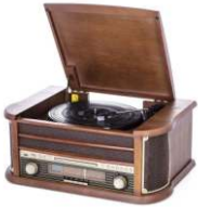
Turntable with radio CR 1111