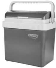
Portable cooler CR 8065