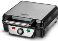
Waffle maker CR 3025