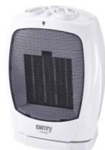
Ceramic Heater CR 7718