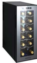
WINE COOLER CR 8068