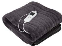
Super soft heating blanket CR 7418