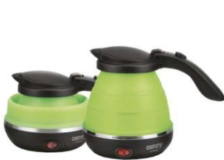
Foldable Electric Kettle CR 1265