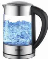
Kettle with temp. control CR 1289