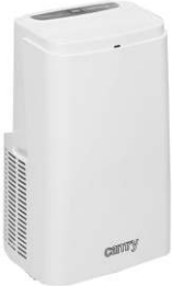
Air conditioner CR 7907