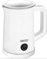
Milk Frother CR 4464