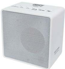
Cube Radio with bluetooth CR 1165