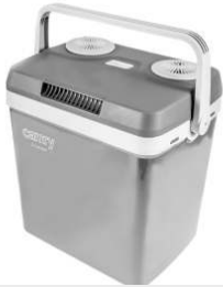
Portable Cooler CR 93