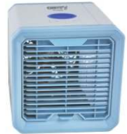
Easy Air Cooler CR 7318