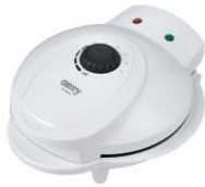
Waffle maker CR 3022