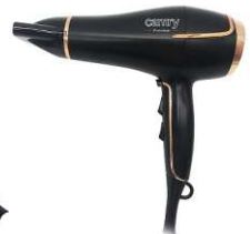
Hair Dryer CR 2255