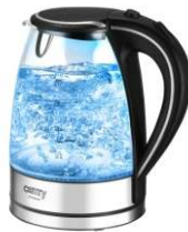
Electric Kettle CR 1239