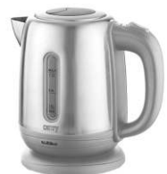
Electric Kettle CR 1278