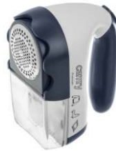
Lint remover CR 9606