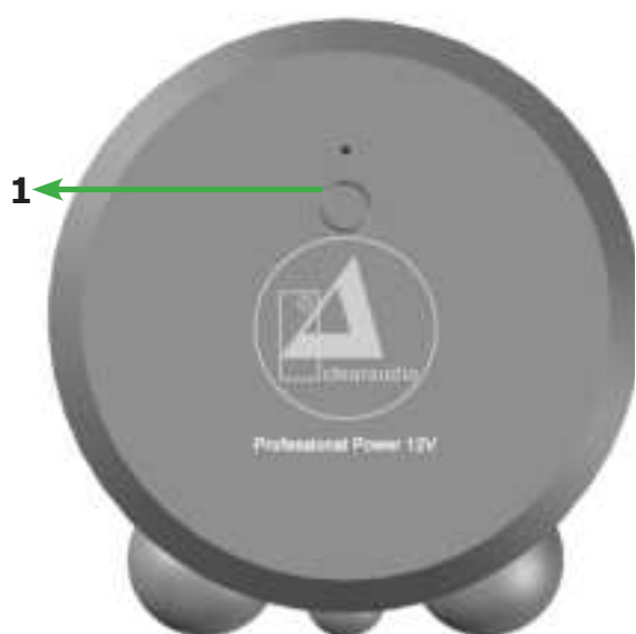
Pic. 1: Front view