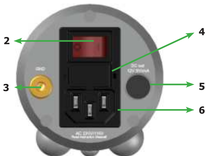
Pic. 2: Rear view