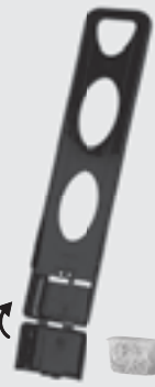
Filtro de carbón para la cafetera