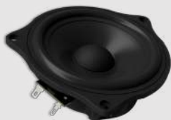
ohne Adapterrahmen without mounting frame