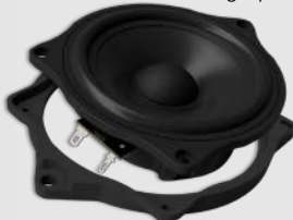
mit Adapterrahmen unten bottom-mounted frame