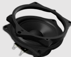
mit Adapterrahmen oben top-mounted frame