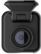
1. الكاميرا الخلفية مع الحامل