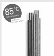
85°C Glitzer Klebesticks 7 mm