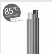
85°C Colour Klebesticks 7 mm