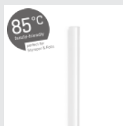
85°C Cristal Klebestick 7 mm