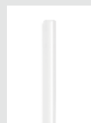
85°C Cristal Klebesticks 7 mm