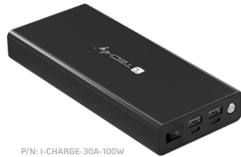
P/N: I-CHARGE-30A-100W 8059018366006