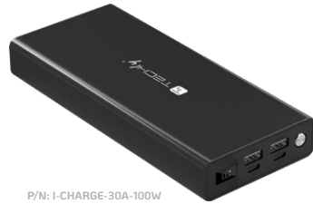
P/N: I-CHARGE-30A-100W 8059018366006