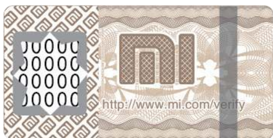
Стертая наклейка для защиты от подделок