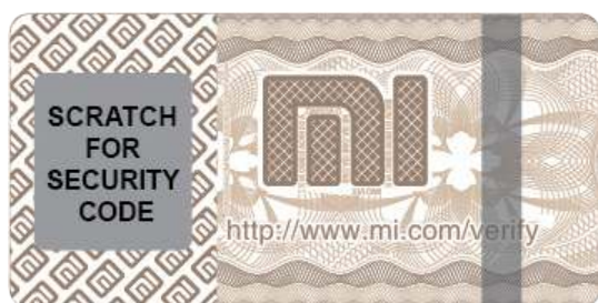
Наклейка для защиты от подделок

Каждый Внешний аккумулятор Mi Power Bank поставляется с наклейкой для защиты от подделок на наружной упаковке. Сотрите покрытие и перейдите на сайт http://chaxun.mi.com , чтобы проверить подлинность продукта.